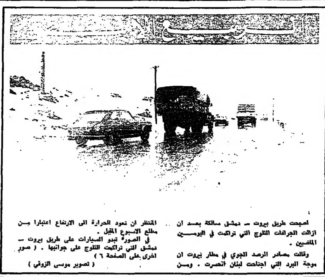
أصبحت طريق بيروت - دمشق سالكة بعد أن انزلت الجرعات الثلاث التي تراكمت في اليومين الماضيين.